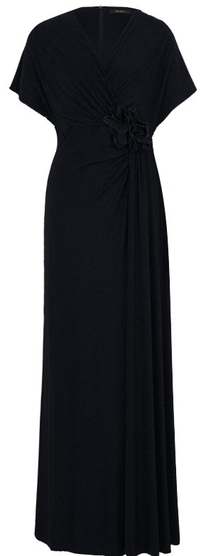
Vera Mont Abendkleid 279 99