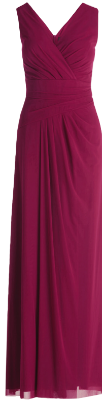
Vera Mont Abendkleid 229 99