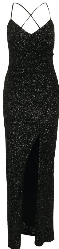
VM Vera Mont Abendkleid 259 99