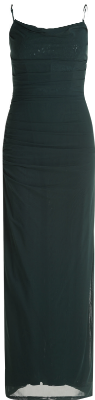
VM Vera Mont Abendkleid 199 99